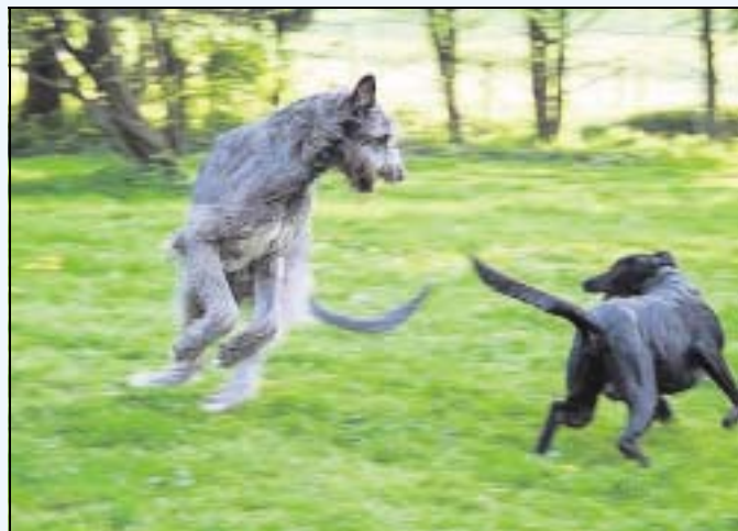
Auch im Spiel macht der Vierbeiner eine gute Figur.

Zugegeben, wenn ein Rüde mit einer Schulterhöhe von bis zu 100 cm vor jemandem steht, kann einem schon „Angst und Bange“ werden. Lernt man die Rasse, die zu den Windhunden zählt, näher kennen, werden alle grausamen Vorurteile gegenüber des „Riesen“ vergessen. Die manchmal weiß oder auch schwarzen, aber meistens grauen Hunde stammen ursprünglich aus Irland. Die außergewöhnlichen Hunde sind