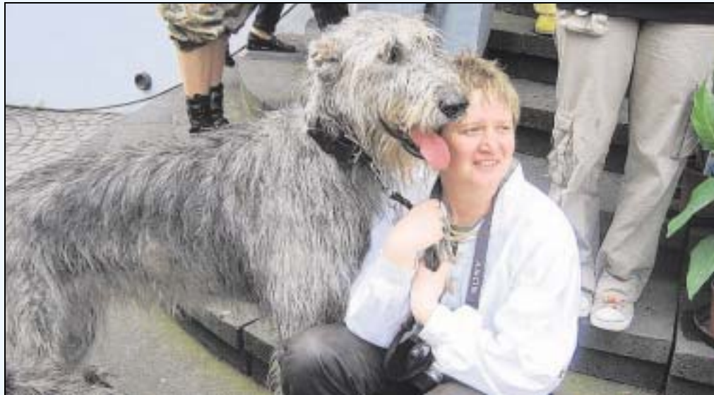
Mit einer Schulterhöhe bis zu 100 cm bietet der „Irish Wolfhound“ ein beeindruckendes Bild.